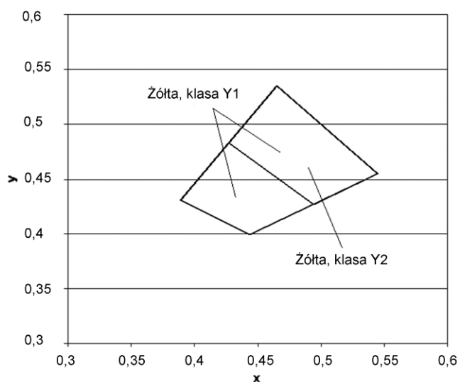
Rys.2. Współrzędne chromatyczności x,y dla barwy żółtej oznakowania